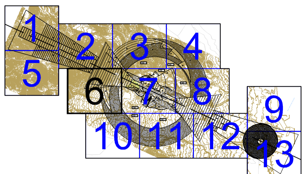
PLANO LLAVE 1:250.000

CARTOGRAFIA Coordenadas: UTM ED50