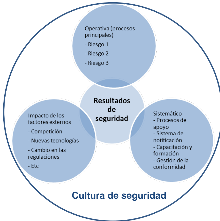
Figura 1.- Componentes del rendimiento en materia de seguridad operacional

Los principios anteriores son válidos tanto desde la perspectiva del regulador como desde la perspectiva de un proveedor de servicios individual, en todos los casos se debe considerar la naturaleza dinámica de los componentes sistémicos, operacionales y externos para el rendimiento en materia de seguridad operacional.